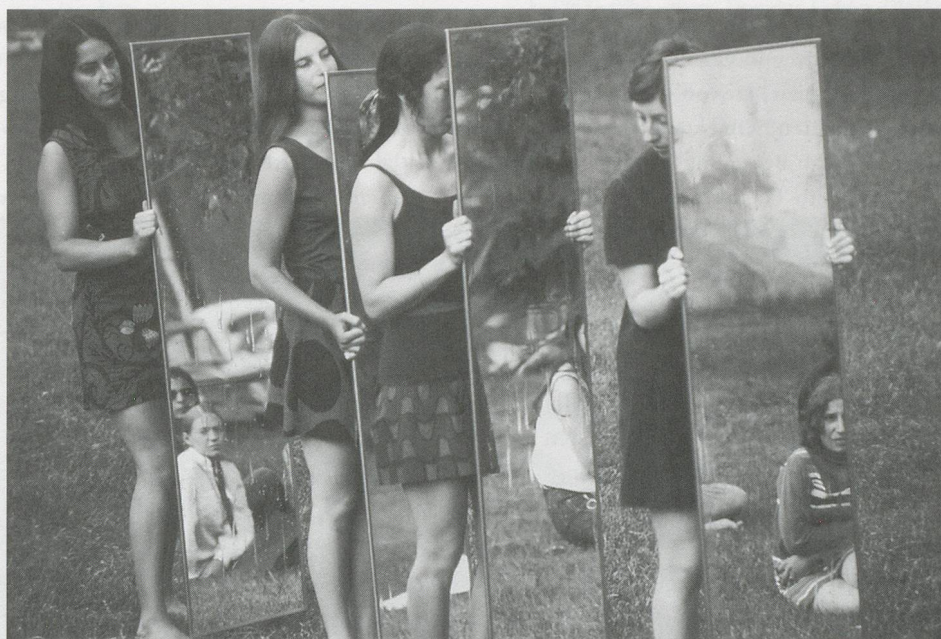
JOAN JONAS, MIRROR PIECE I, 1969, Bard College, Annandale-on-Hudson, New York.

verzahnt sie kulturelle und mythologische Epen mit privaten Begebenheiten, Videobildern und anderen Medien. Fast immer geht Jonas räumlichen und wahrnehmungsbedingten Phänomenen nach und lässt dabei Elemente aus Tanz, Zeichnung, Skulptur oder dem japanischen No- und Kabuki-Theater einfließen. Das war schon bei MIRROR PIECE (Spiegelstück, 1967) der Fall.