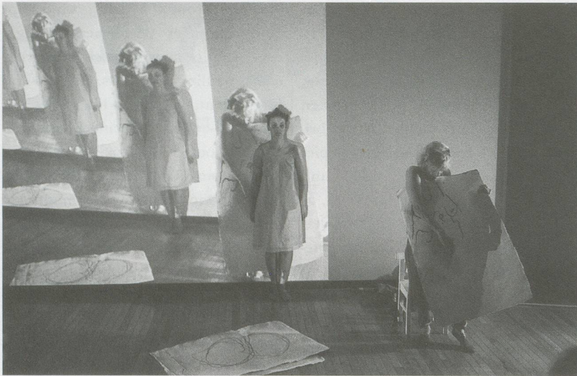
JOAN JONAS, CROSSED WAVES , 2003, performance at Queens Museum, New York, March 2004, originally performed at The Moore Space, Miami, October 2003 / Performance in Queens Museum, New York, März 2004, Erstaufführung im Moore Space, Miami, Oktober 2003.

medieval myth about a young woman (played by Tilda Swinton) whose dreams foretell the future. Shot in the dramatic natural landscapes of Iceland and in New York, the performance-based work uses ancient dream analysis as a starting point for a densely textured tale in which the young woman's interpreter (played by Ron Vawter) hears her dreams and sees their meaning. Jonas employs multilayered digital effects to create a ritualistic dreamscape of the young woman's imagination and desires. The ghostly overlays of otherworldly images and mythical text imbue this work with a haunting beauty.