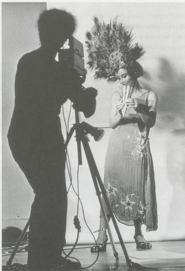
JOAN JONAS, ORGANIC HONEY'S VERTICAL ROLL, 1972/1973, production still, Musée Galliera, Paris.

contrasts between Erik Satie and rock music. Combining past myths with the present, Jonas juxtaposes time and idea to create more tensions for the viewer, who, meandering through a set comprising monitors, drawings, and objects, gradually untangles the web.